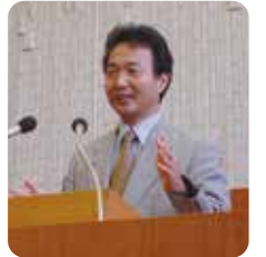
市議会本会議場にて

1954年 山口県生まれ 広島音楽高等学校声楽科卒業 昭和音楽短期大学声楽科卒業 2000年 白井町議会議員初当選 2011年より中央大学法学部 通信教育課程入学 現在4年在学中