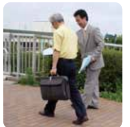
駅頭での議会報告配布

白井市議会副議長 白井市議会産業民生常任委員長 白井市議会環境経済常任委員長 白井市議会議会運営委員長 白井市議会決算審査特別委員長 白井町区長会理事 北総線値下げ裁判原告 北総・公団鉄道運賃値下げを実現する会(北実会)会長